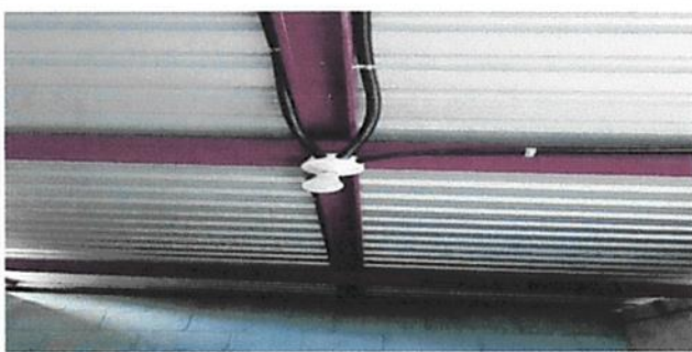
Foto 5: Cambio de Bombillas, plafoneras y cableado con mejor seguridad en toda las aulas.